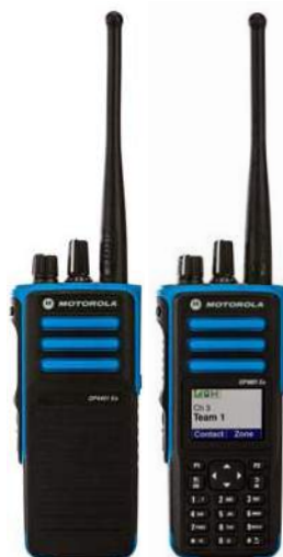
DP4401 Ex (senza display)

DP4801 Ex - Aggiunge la tastiera completa e un grande display a colori per accedere a funzioni avanzate come la messaggistica di testo e l'identificazione del chiamante.